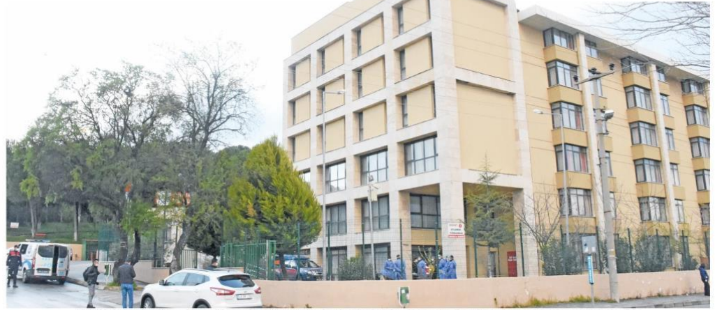
Muğla'nın Mentese ilçesindeki Kötekli Mahallesi'nde bulunan Gençlik ve Spor Bakanlığına bağlı yurtlara yerleştirilenler, 14 günlük karantina sürecinin ardından evlerine gönderilecek.

İhtiyaçları Muğla Valiliği, İl Sağlık Müdürlüğü, AFAD, Gençlik ve Spor İl Müdürlüğü ile Türk Kızılay tarafından karşılananlar, tek kişilik odalarda kalıyor. Pencereleere çıkarak şarkı söyleyen, birbirleriyle sohbet eden vatandaşlar, sunulan hizmet